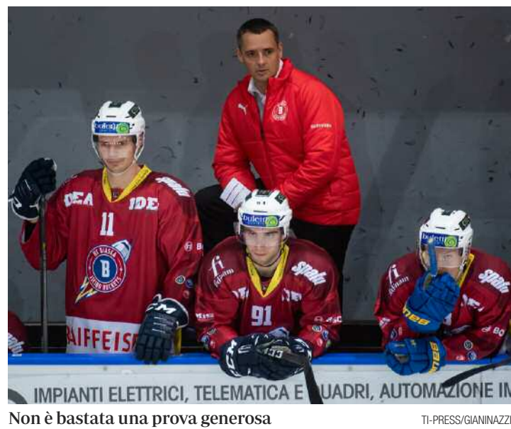
Non è bastata una prova generosa